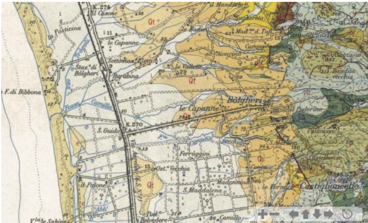
Cartina Geopedologica della zona di Bolgheri